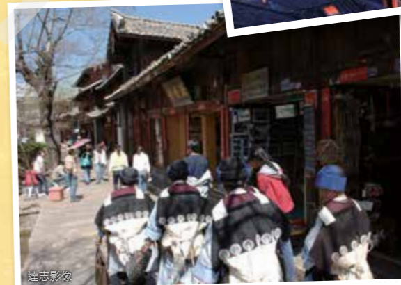
納西族婦女的傳統服飾，身穿寬袖布袍，羊皮披肩上有七個圓形繡飾，代表北斗七星，象徵婦女的日夜辛勞。

走在麗江古城中，不時會遇到穿著傳統服飾的納西族人。納西族婦女的傳統服裝很特別，她們會披著一件「七星羊皮」，是用羊皮製成的小披肩，並裝飾上七個圓形布飾，象徵納西婦女日夜不休、披星戴月的辛勞。