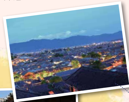
從高處俯瞰麗江古城，層層疊疊的屋瓦，宛如封印在時間洪流裡。

我到四方街時已近黃昏，眼前的石板路突然開始積水，水是流動的，而且很乾淨。哈，原來是在「洗街」！居民利用地勢的高低落差，將水閘門打開，讓水漫上石板路，沖洗地面。聽說這並不是常能遇到，能見識當地人自古以來的用水智慧，我真幸運。